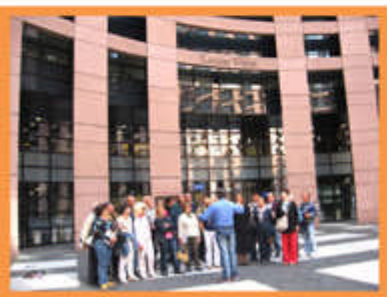
Piccolo concerto al Parlamento Europeo - Strasburgo