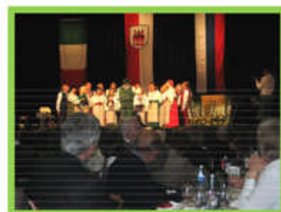
Concerto nella Grande Sala Comunale