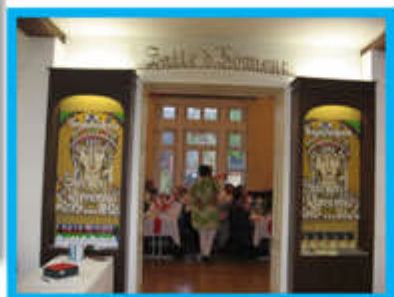
Casa delle Associazioni