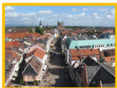
Altro simbolo di Speyer: il Duomo