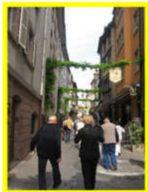
Passeggiata a Strasburgo