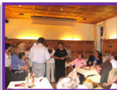
Piccolo concerto al Domhof