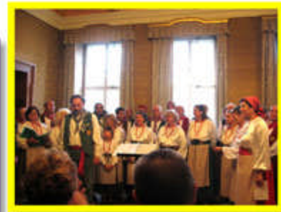
Concerto nella Storica Sala Comunale - fine concerto