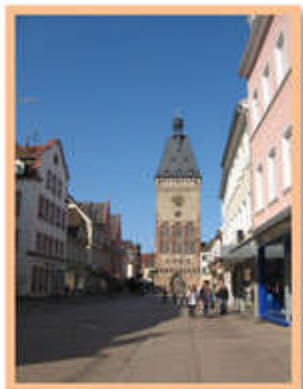
Un simbolo di Speyer: la Vecchia Porta