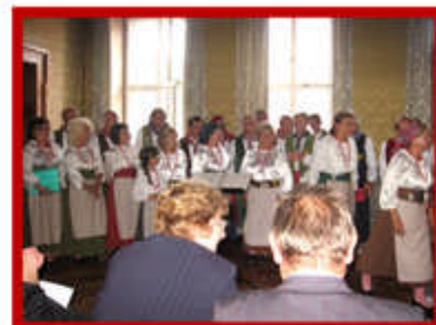
Concerto nella Storica Sala Comunale - fine primo tempo